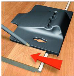
Lineal + Winkel